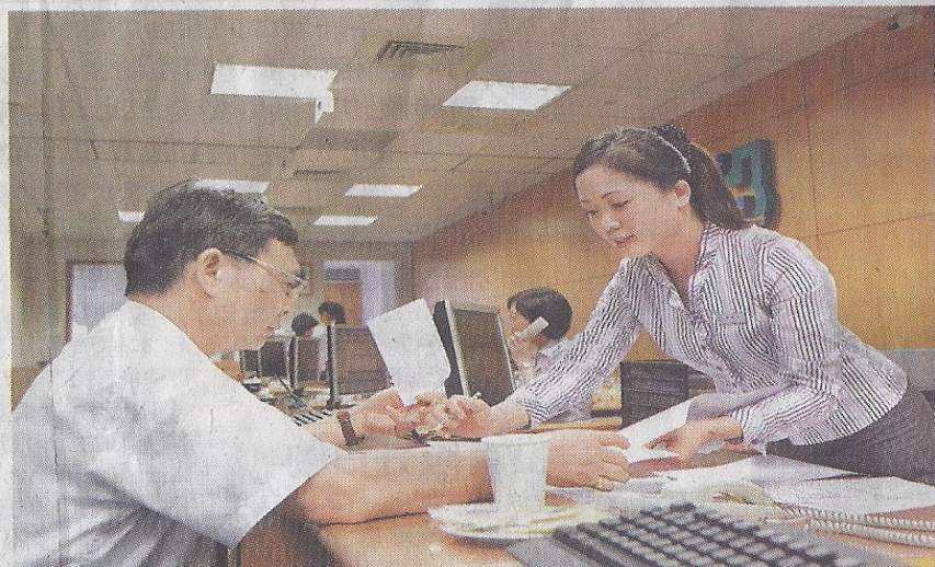
■台幣今年來強勢升值，讓兼具壽險保障的美元保單業績夯。

除匯兌風險外，鄭本源強調，由於以繳交保費及給付保險金都是以美元支付，如果保戶的銀行帳戶不是保險公司的指定銀行，包括匯款銀行手續費、郵電費、國外中間行手續費、受款銀行手續費等，費用加起來恐超過2000元。