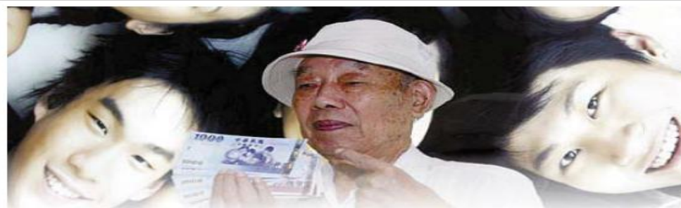
● 民眾規劃養老、留學，外幣保單是好選擇。

（全殘）保障；繳費期滿後，保額則按年複利3.5%逐年增值至110歲，保額複利增額，讓民眾可避掉因通膨帶來保障不足的影響。